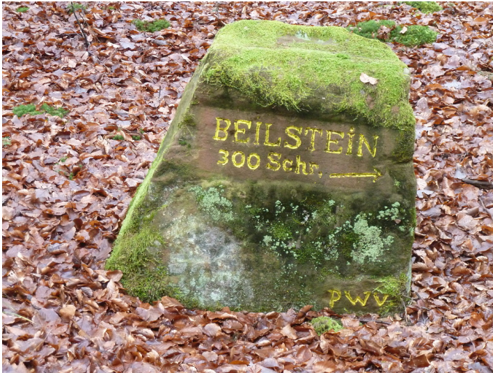
Ritterstein Nr. 162 "Beilstein 300 Schr." bei Kaiserslautern (2017)