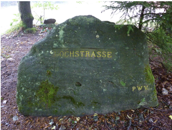
Ritterstein Nr. 160 Hochstrasse bei Frankenstein (2014)