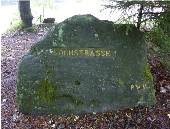
Ritterstein Nr. 160 Hochstrasse bei Frankenstein (2014)