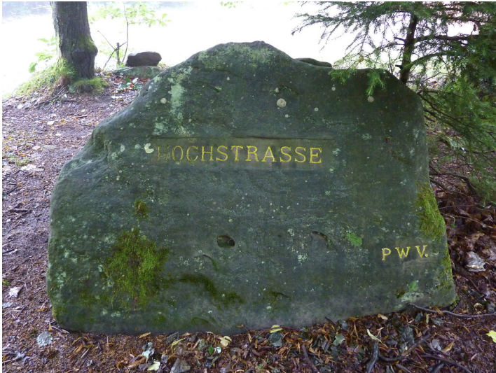
Ritterstein Nr. 160 Hochstrasse bei Frankenstein (2014)