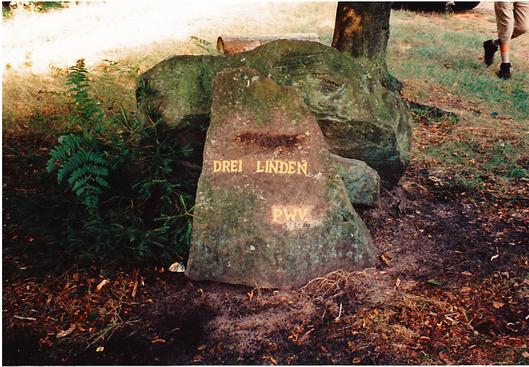
Ritterstein Nr. 159 "Drei Linden" bei Frankenstein (1995)