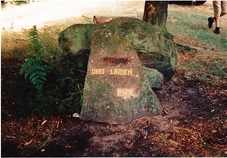
Ritterstein Nr. 159 "Drei Linden" bei Frankenstein (1995)