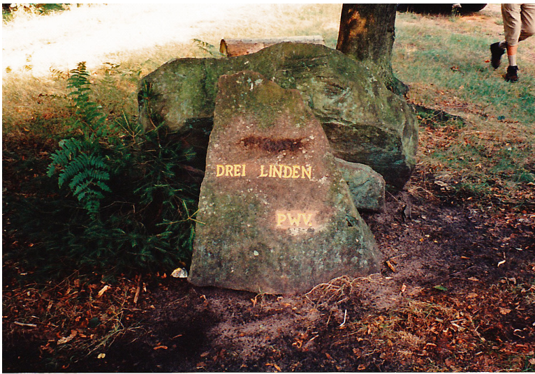
Ritterstein Nr. 159 "Drei Linden" bei Frankenstein (1995)