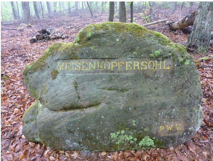
Ritterstein Nr. 158 Meisenkopfersohl bei Hochspeyer (2014)