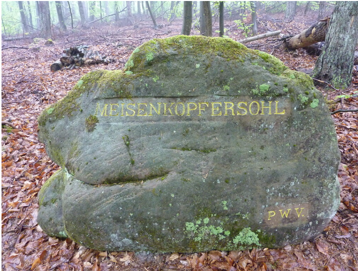
Ritterstein Nr. 158 Meisenkopfersohl bei Hochspeyer (2014)