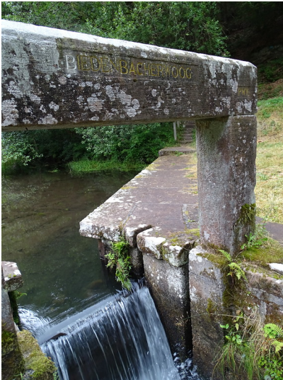
Ritterstein Nr. 156 "Biedenbacherwoog" im Leinbachtal (2018)