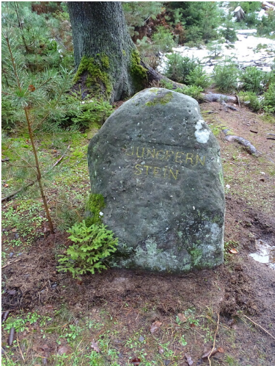
Ritterstein Nr. 152 "Jungfernstein" bei Kaiserslautern (2020)