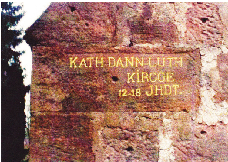
Ritterstein Nr. 137 "Kath-Dann-Luth Kircge 12-18 Jhdt." (1999)