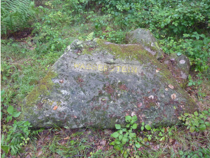
Ritterstein Nr. 155 Wasserstein bei Frankenstein (2014)