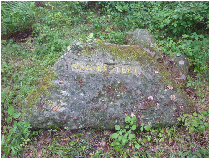
Ritterstein Nr. 155 Wasserstein bei Frankenstein (2014)