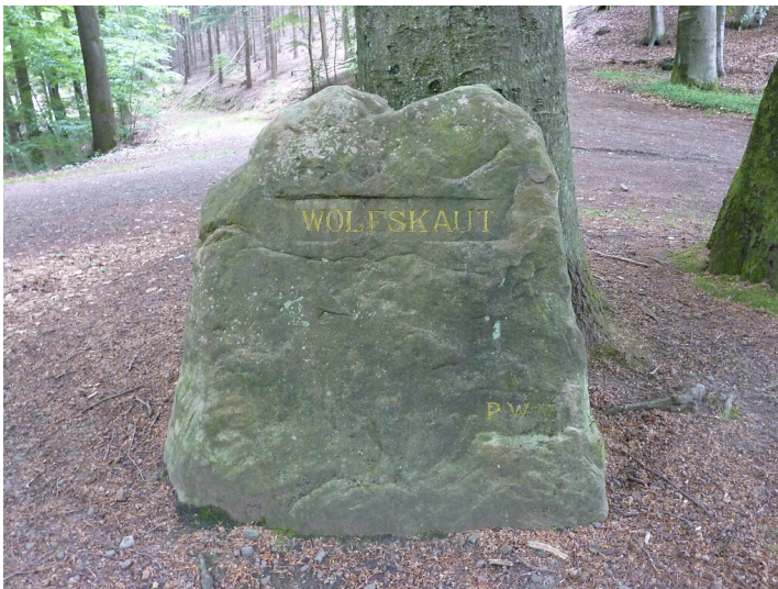
Ritterstein Nr. 147 "Wolfskaut" bei Kaiserslautern (2014)