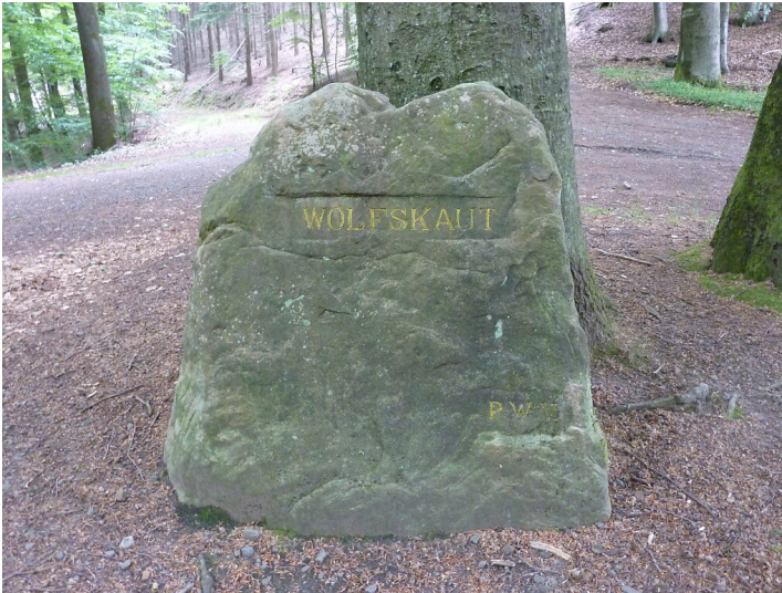
Ritterstein Nr. 147 "Wolfskaut" bei Kaiserslautern (2014)