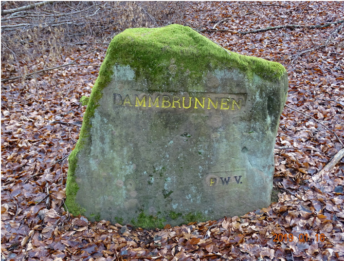
Ritterstein Nr. 146 "Dammbrunnen" am Dammberg (2019)