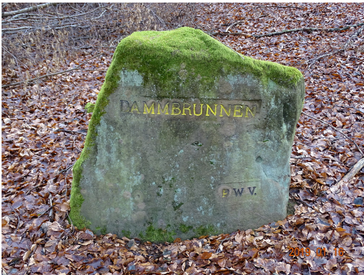
Ritterstein Nr. 146 "Dammbrunnen" am Dammberg (2019)