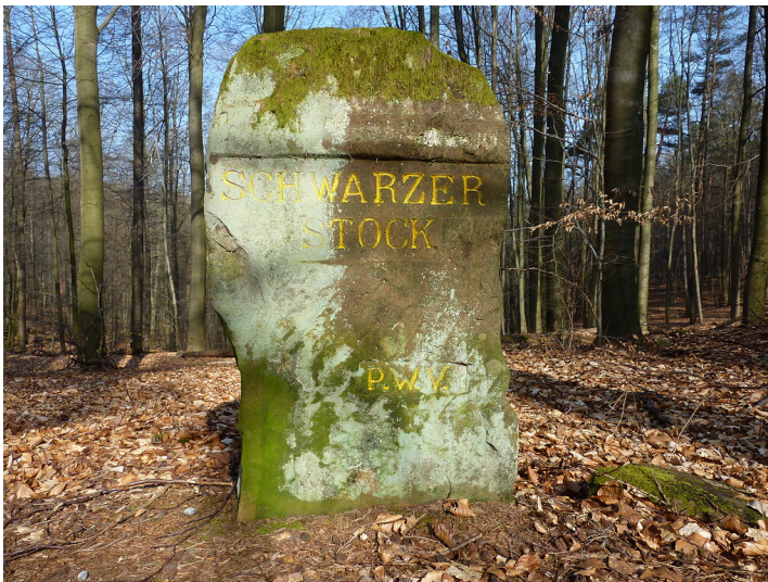
Ritterstein Nr. 141 Schwarzer Stock östlich von Waldleiningen (2014)