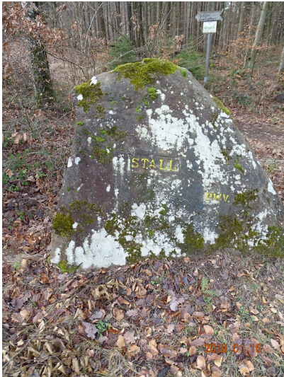
Ritterstein Nr. 140 Stall bei Waldleiningen (2019)