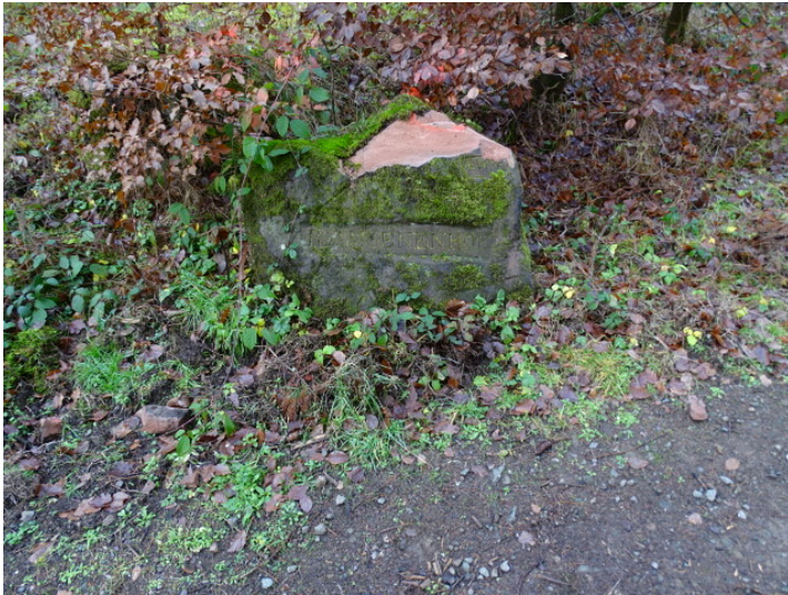
Ritterstein Nr. 124 R. Amoenenhof im Moosalbtal (2018)