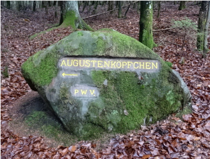
Ritterstein Nr. 123 Augustenköpfchen bei Mölschbach (2018)