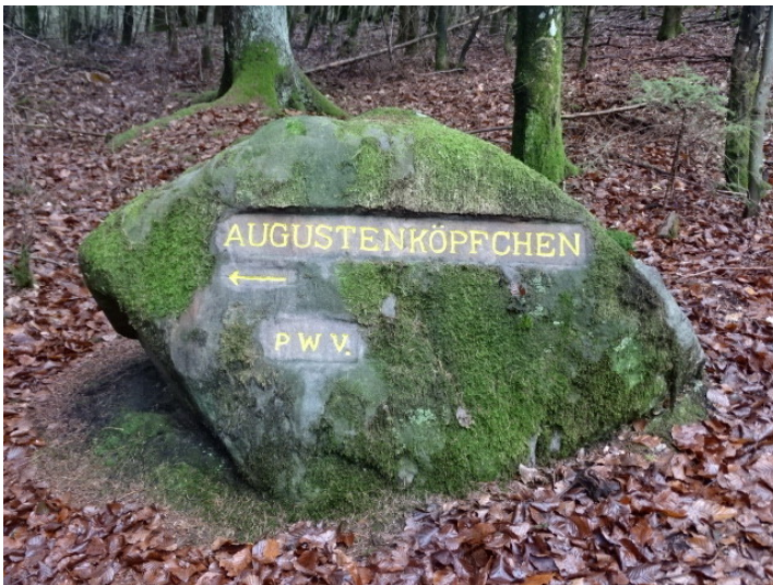
Ritterstein Nr. 123 „Augustenköpfchen“ bei Mölschbach (2018)