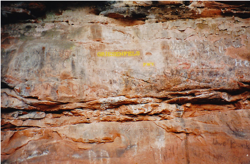
Ritterstein Nr. 154 "Griesenfels" im Leinbachtal (1993)