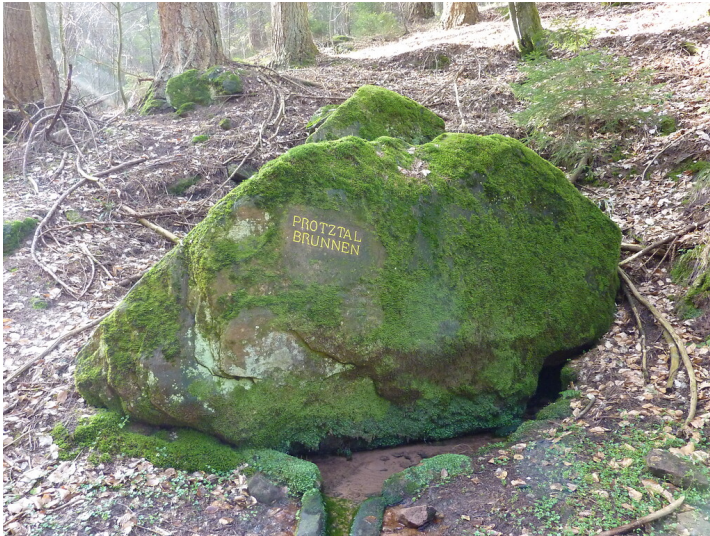
Ritterstein Nr. 148 Protztalbrunnen im Leinbachtal (2014)