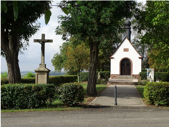
Anlage an der Kriegergedächtniskapelle auf dem Häselberg bei Reifenberg (2018)