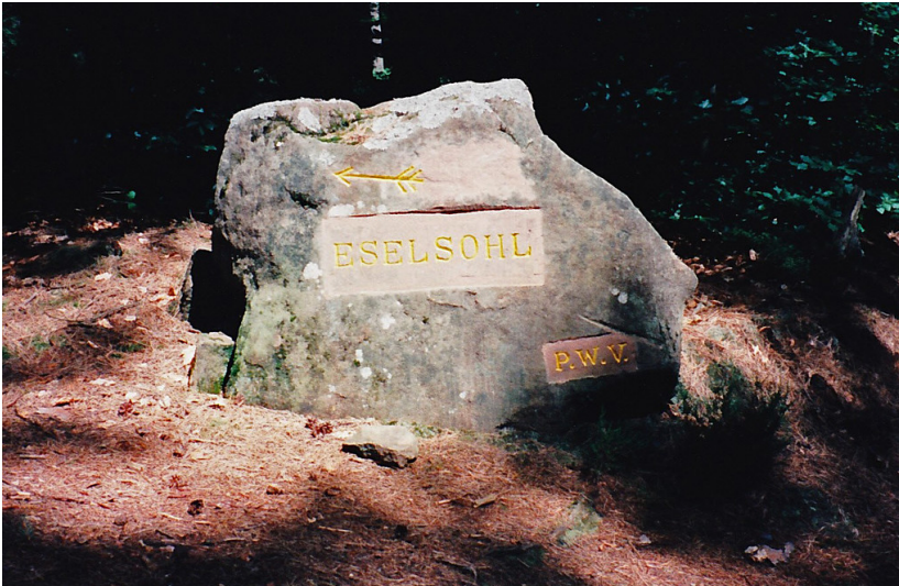
Ritterstein Nr. 143 „Eselsohl“ bei Weidenthal (1997)