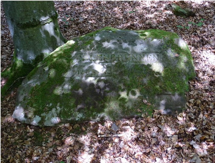
Ritterstein Nr. 127 Erlenbrunnen 140 Schr. am Erlenbrunneck (2019)