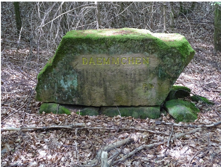
Ritterstein "Daemmchen" (Nr. 117) bei Waldleiningen (2019)