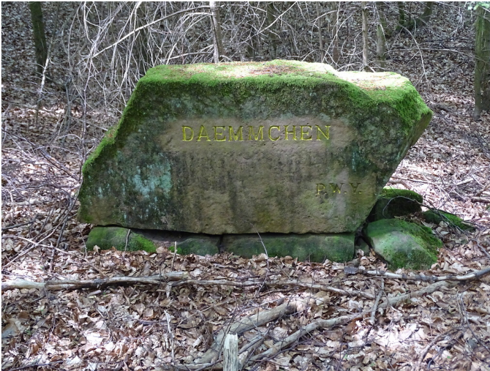
Ritterstein "Daemmchen" (Nr. 117) bei Waldleiningen (2019)