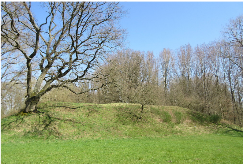
Lauterlinien im Bienwald (2018)