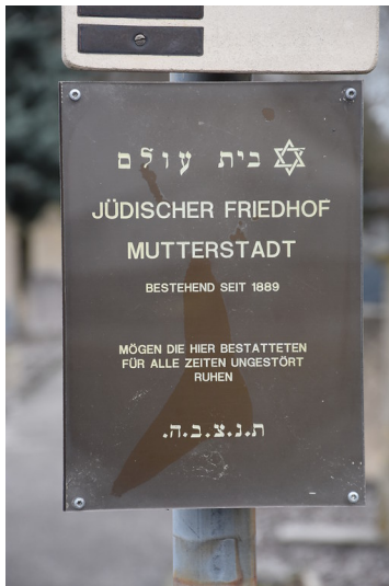
Jüdischer Friedhof in Mutterstadt (2018)