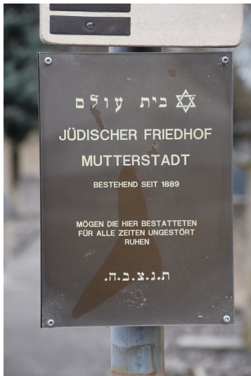
Jüdischer Friedhof in Mutterstadt (2018)