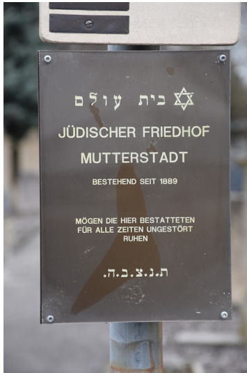
Jüdischer Friedhof in Mutterstadt (2018)