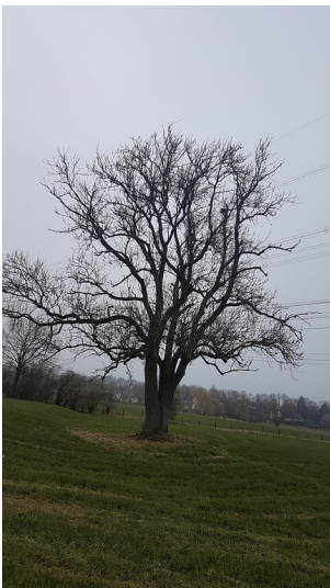
Alte Huteesche auf historischem Grünland in der Mommniederung bei Voerde (2018)