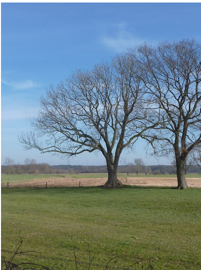
Altbaum in der Lippeaue 2018