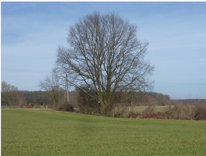
Altbaum in der Lippeaue 2018

Schlagwörter: Solitärbaum , Stieleiche , Kopfbaum Fachsicht(en): Naturschutz, Kulturlandschaftspflege Gemeinde(n): Hünxe Kreis(e): Wesel Bundesland: Nordrhein-Westfalen