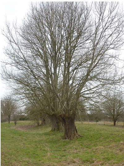
Eschen nordöstlich der Gartroper Aap in der Lippeaue (2018)