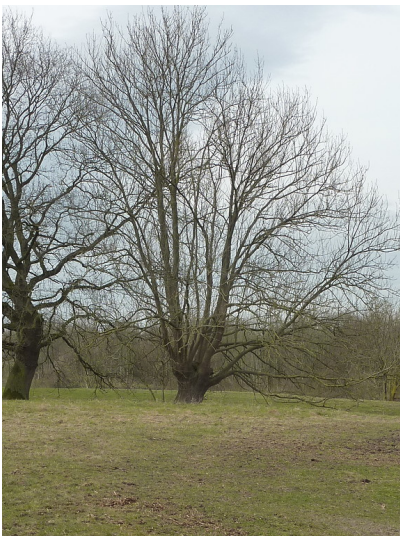
Esche nordöstlich der Gartroper Aap in der Lippeaue (2018)