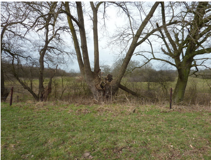
Pappel südlich der Lippe bei Schloss Gartrop in der Lippeaue (2018)