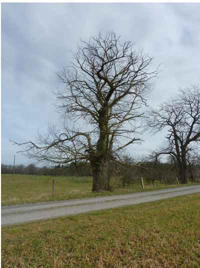
Edelkastanie östlich vom Schloss Gartrop in der Lippeaue (2018)