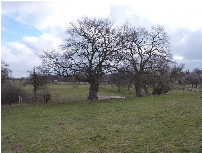
Stieleiche nördlich vom Welmer Hof in der Lippeaue (2018)