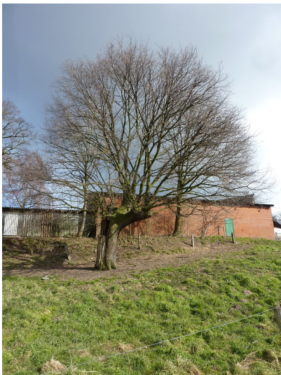
Kopfeiche am Welmer Hof in der Lippeaue (2018)

Schlagwörter: Solitärbaum , Stieleiche , Kopfbaum Fachsicht(en): Naturschutz, Kulturlandschaftspflege Gemeinde(n): Hünxe Kreis(e): Wesel Bundesland: Nordrhein-Westfalen