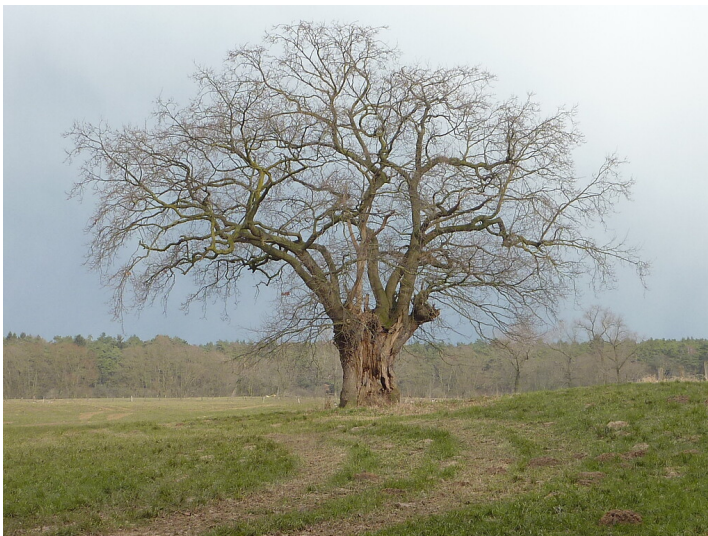
Altbaum in der Lippeaue 2018