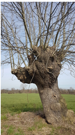
Alte Kopfesche in der Mommniederung bei Voerde (2018)