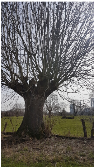
Alte Kopfesche in der Mommniederung bei Voerde (2018)