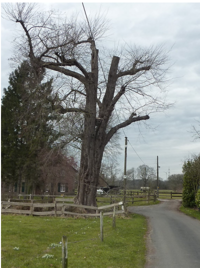
Altbaum in der Lippeaue 2018