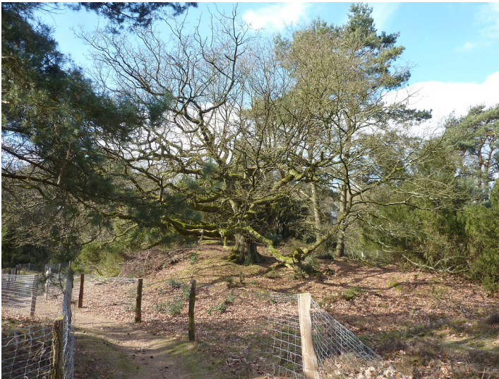
Altbaum in der Lippeaue 2018