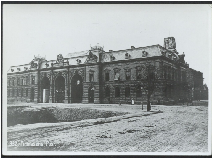
Historische Fotografie der Alten Post in Pirmasens (um 1900)