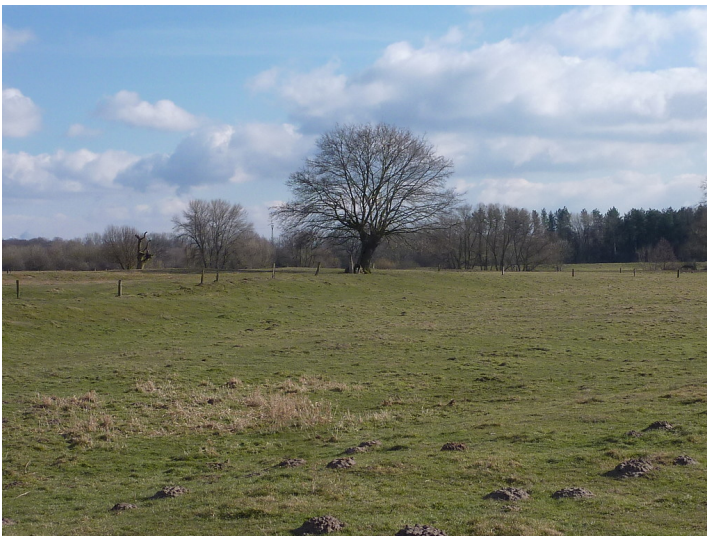
Altbaum in der Lippeaue 2018

Schlagwörter: Solitärbaum , Stieleiche , Kopfbaum Fachsicht(en): Naturschutz, Kulturlandschaftspflege Gemeinde(n): Schermbeck Kreis(e): Wesel Bundesland: Nordrhein-Westfalen