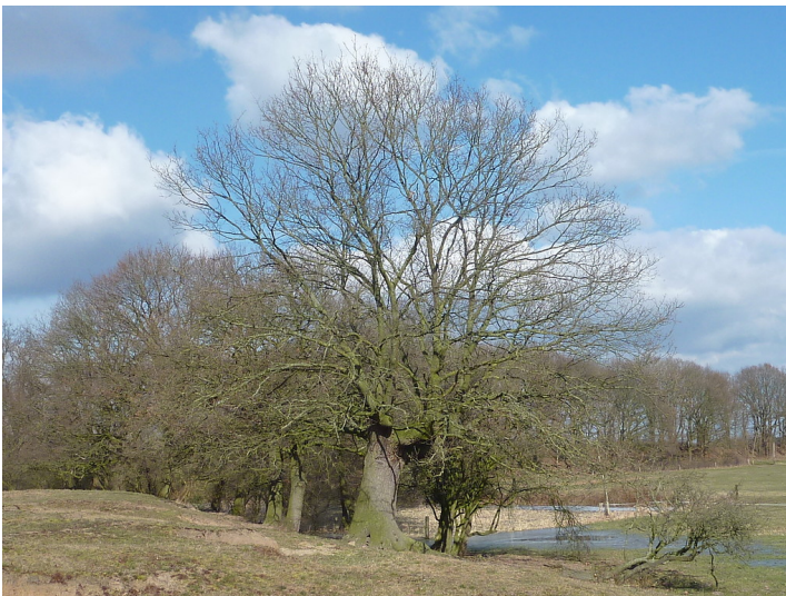
Altbaum in der Lippeaue 2018