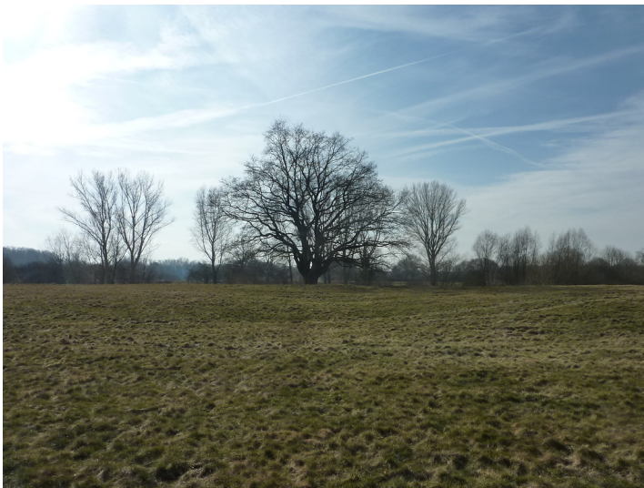
Altbaum in der Lippeaue 2018

Schlagwörter: Solitärbaum , Stieleiche , Kopfbaum Fachsicht(en): Naturschutz, Kulturlandschaftspflege Gemeinde(n): Schermbeck Kreis(e): Wesel Bundesland: Nordrhein-Westfalen