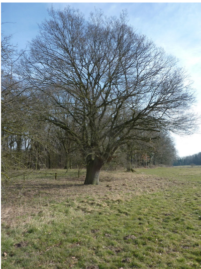
Altbaum in der Lippeaue 2018