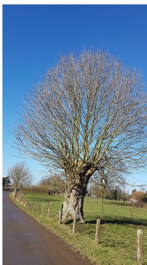
Kopfesche in der Mommniederung bei Voerde (2018)