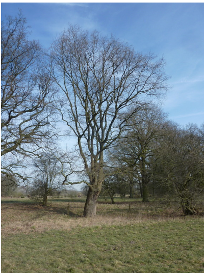
Altbaum in der Lippeaue 2018