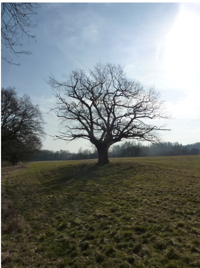
Altbaum in der Lippeaue 2018