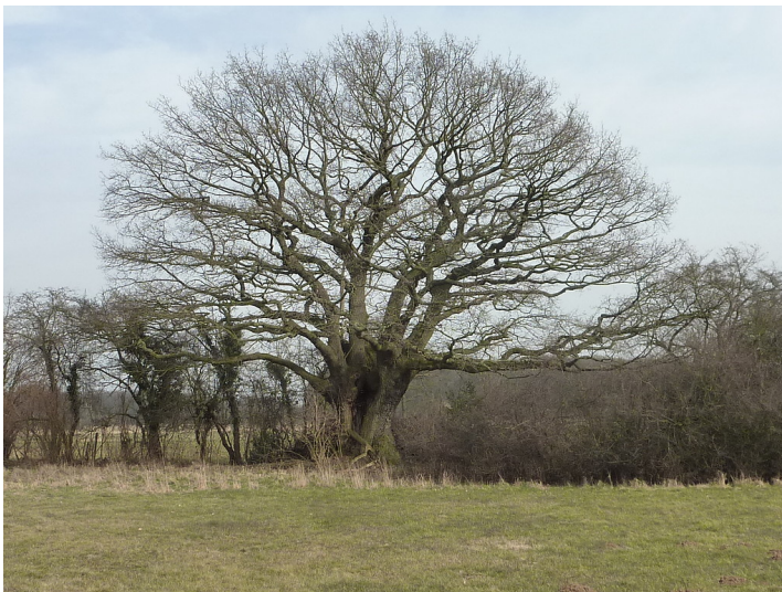
Altbaum in der Lippeaue 2018